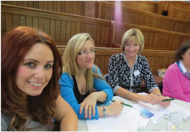
Cynrychiolydd yn y cyfarfod cyffredinol blynyddol