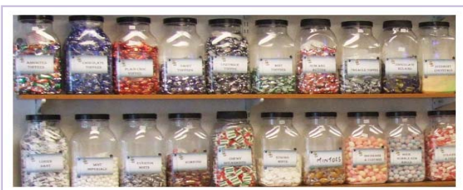
Village and Valleys Community Sweetshop Ferndale

Prosiect Datblygu Cymuned Llanharan – Prosiect Caffi – Grŵp Cymorth i Bensiynwyr